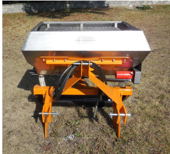
TIPO 120 INT 1P E 2P A LARGHEZZA cm 92 340 litri