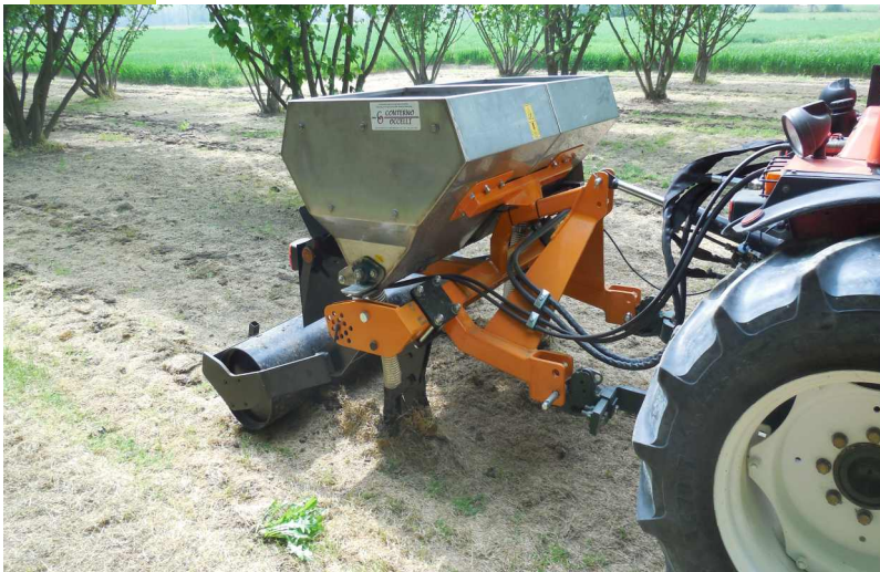
TIPO 140 INT 2P2V A LARGHEZZA VARIABILE cm 105 - 150. 400 litri