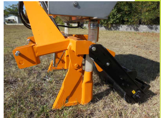
Ancore a scalpello o a taglio