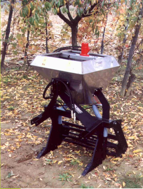
TIPO 80 INT 1P E 2P A LARGHEZZA cm 76 230 litri